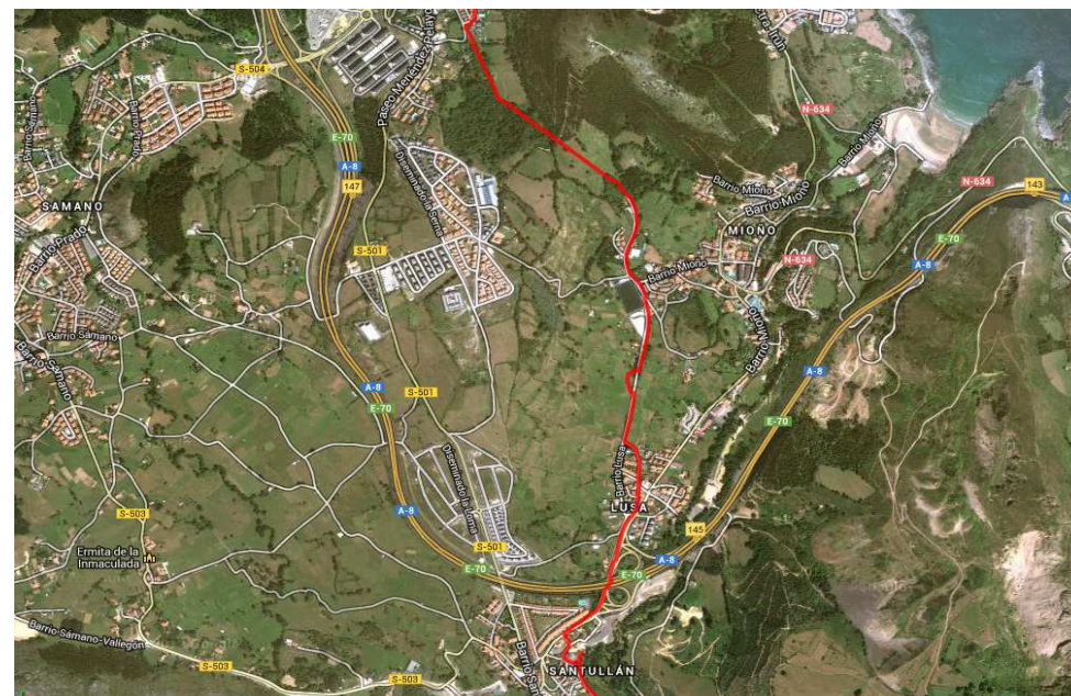
Altitud (m)/distancia (km)