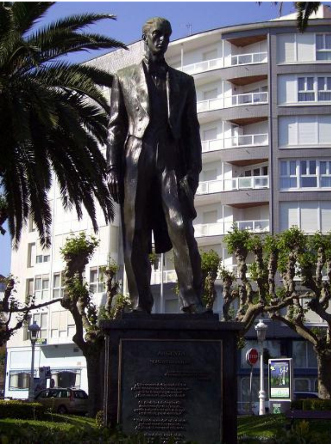
Castro Urdiales 1913- Madrid 1958. Músico y compositor