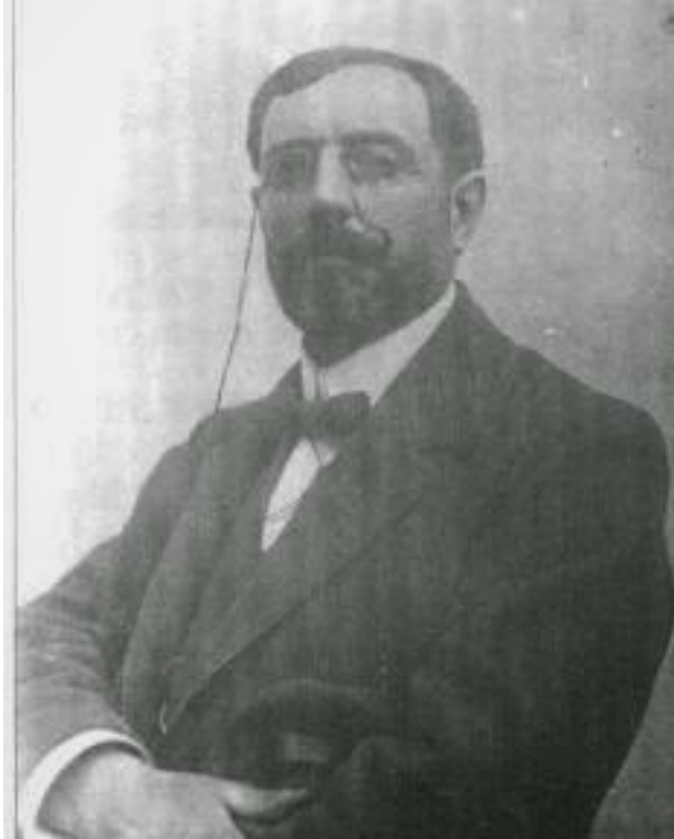
Castro Urdiales 1864- Santa Cruz de Tenerife 1941 Arquitecto