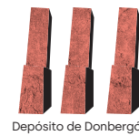
Depósito de Donbergón