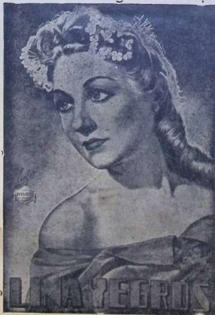
La insigne actriz Lina Yegros, que actúa con gran éxito en el Teatro de la Villa

Hoy domingo por la tarde y noche será puesta en escena la grandiosa obra de Leandro Navarro titulada «COMO TU ME QUERIAS» y mañana lunes, se hará la grandiosa obra de Muñoz Seca «Las Hijas del Rey Lear», grandes éxitos de esta Compañía.