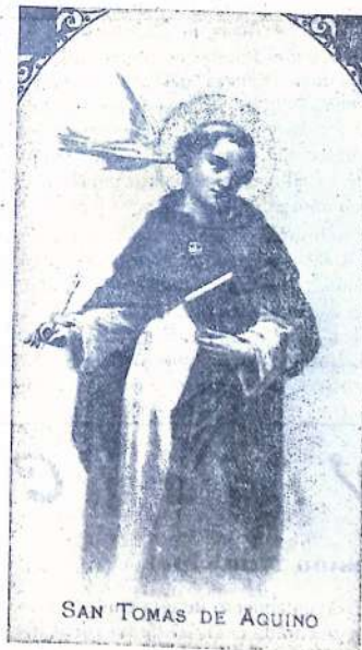
SAN TOMAS DE AQUINO

Y por eso él fué el señalado por el mismo S. Alberto Magno para que parara la corriente científica equivocada, que los