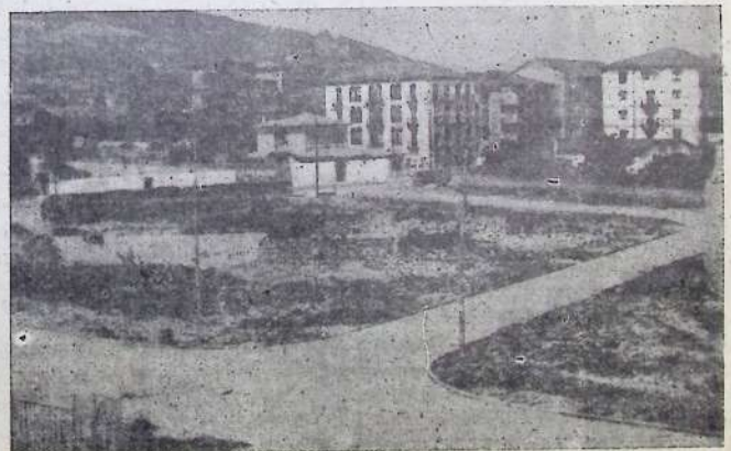
Una vista del nuevo ensanche en su estado actual.