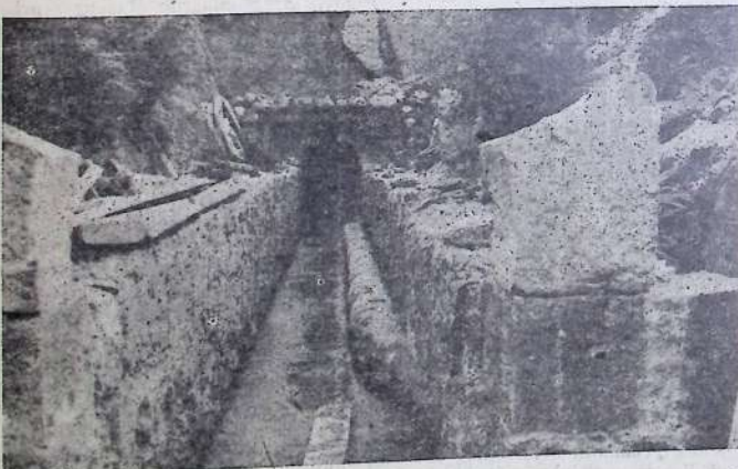
Boca del túnel que da acceso a la gruta donde tiene su nacimiento el manantial de La Suma. Esta entrada será arqueada con cemento y mampostería y cerrada con una portada de hierro forjado.

es mucho mayor que cuando Castro fué dotado de este servicio, razón fácilmente comprensible si tienes en cuenta que las exigencias de la vida moderna requieren en viviendas, industrias y fabricación un consumo inmensamente mayor que el previsto cuando se efectuaron estas obras. Si a esto le añades el atroz estiaje de estos últimos años que mermó los caudales hasta lo imposible, se comprenderá enseguida el agudísimo problema creado y la urgente necesidad de atacar