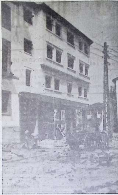
El edificio en construcción de viviendas para los maestros anejo a los nuevos edificios para dependencias oficiales y que corresponde a la edificación del nuevo ensanche