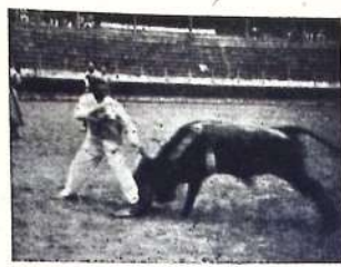
La gran estocada de Lozana al toro de su triunfo

Después del ágape se dió suelta a un bravísimo becerro de El Espinar al que torearon a placer una buena legión de comensales, entre los que se encontraba el hombre gordo, acreditado industrial minero de los predios sopuertanos. Toto perfumó el ambiente con unas chiclelinas muy ceñidas ciabogando en la misma