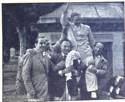
El triunfador a hombros

Le concedieron las orejas y a hombros de cuatro capitalistas se le llevaron hasta el domicilio del Club, donde se piensa