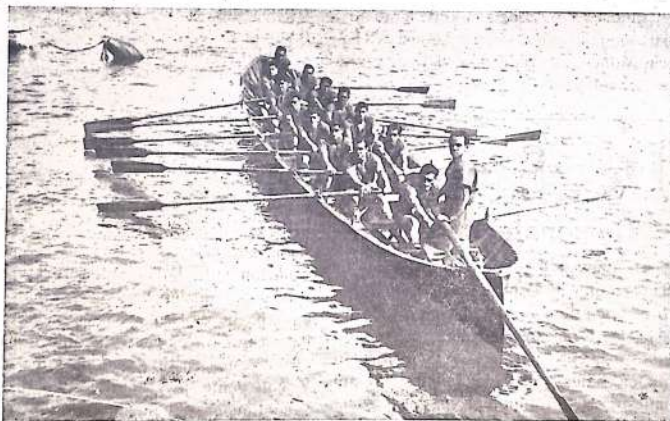
LA TRAINERA CASTREÑA Y TRIPULANTES QUE GANARON BRILLANTEMENTE EL CAMPEONATO DE ESPAÑA DE TRAINERAS EN LA BAHIA DE SANTANDER.