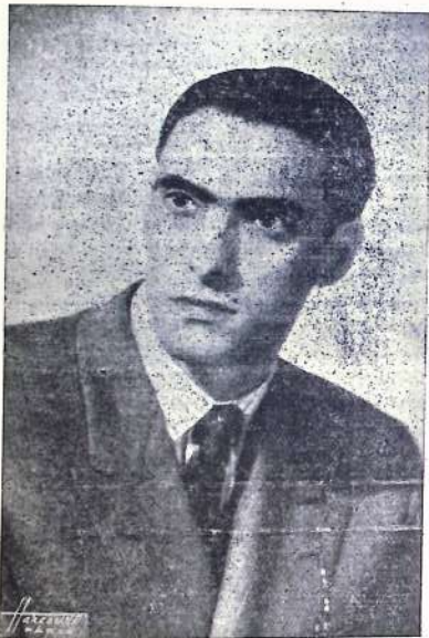
Nuestro paisano el maestro Ataúlfo Argenta que obtuvo el lunes último un clamoroso éxito en el Teatro-Circo al frente de la Orquesta Nacional.

Honor a un castreño de universal proyección