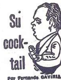
Por Fernando GAVIRIA.