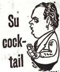
Por Fernando GAVIRIA.