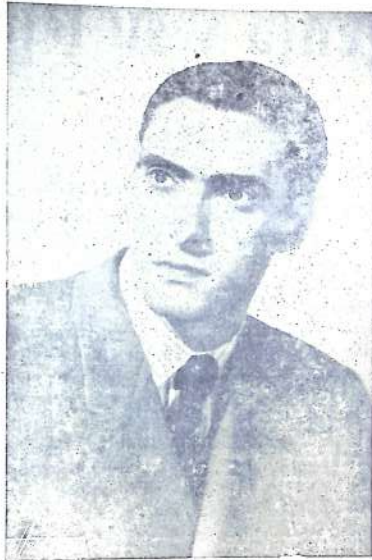
Nuestro ilustre paisano Ataúlfo Argenta, Director de la Orquesta Nacional, a quien el domingo anterior se le rindió un merecido Homenaje.

Más de doscientas cincuenta personas de todas las clases sociales tomaron parte en este original y emotivo banquete. El Abogado y el banquero, el Médico y el industrial, el pescador, el empleado y el obrero, todos los componentes de la Banda de Música y los numerosos cantores del Coro Parroquial y Ochote, compartieron con el homenajeado, apiñados alre-