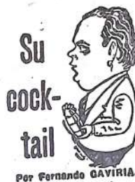
Por Fernando GAVIRIA.