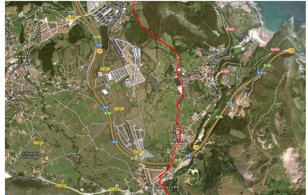
Altitud (m)/distancia (km)